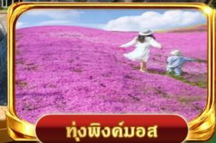
ทุ่งฟิงคิมอส