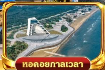
ทอดยกาลเวลา