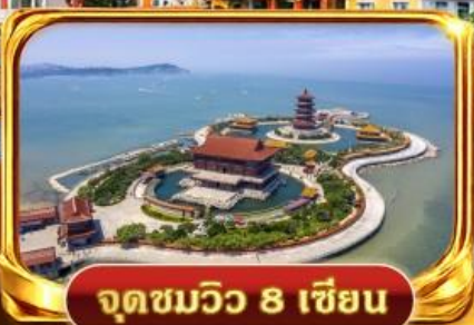
จุดชมวิว 8 เซียน