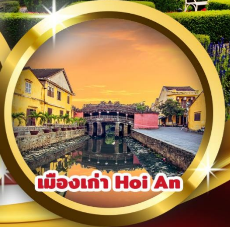
เมืองเก่า Hoi An