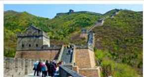
ท่าแพงเมืองจินด่านจวิยงกวน

มือพิเศษ เปิดปิกกิ้ง, สุกี้หม้อไฟ BUFFET