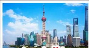
ถ่ายภาพโตโขงหมุก