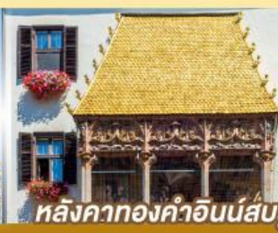
หลังคาทองคำอินน์สบูร์ค