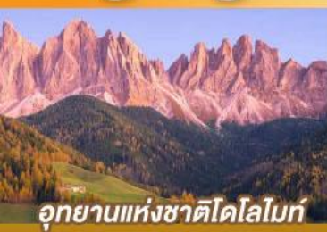
อุทยานแห่งชาติโดโลไมท์

ขึ้นตรงนครอัมสเตอร์ดัม กับเส้นทางสายโรแมนติก พร้อมการแสดงพื้นบ้านสไตล์ที่โรเลียนสุดพิเศษ