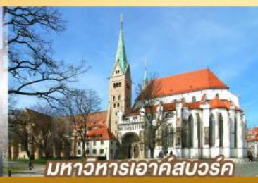
มหาวิหารเอาค์สเวิร์ค