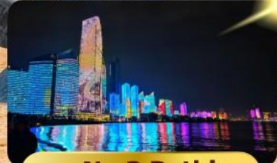
หาด No.3 Bathing

เมนูพิเศษ ซาบูสายพาน 6 วัน 4 คืน เดินทาง : พฤษภาคม 69