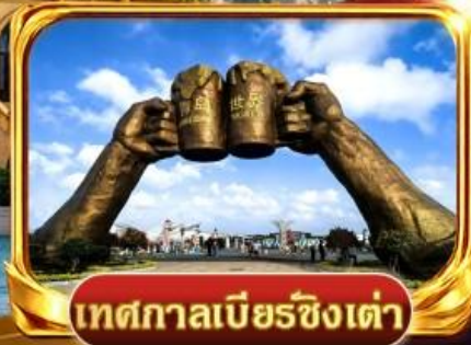
เทศกาลเบียร์ชิงเต่า