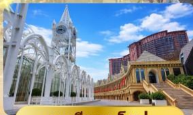
ระเบียยุโรป