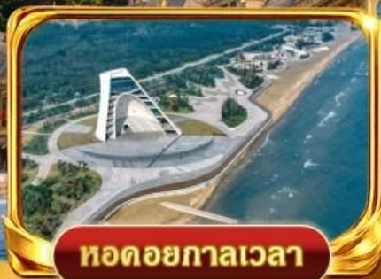
หอดอยกาลเวลา