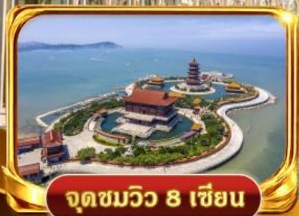
จุดชมวิว 8 เซียน