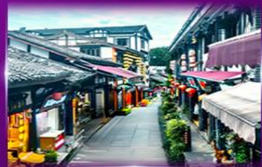
หมู่บ้านโบราณฉิ่งซีโง่ว