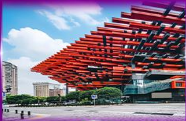
แลนด์มาร์กฉิ่ง ตึกตะเกียบ