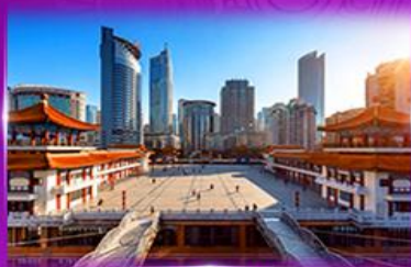
เข็ฉฉิน ตึกโกวฉิงโหล