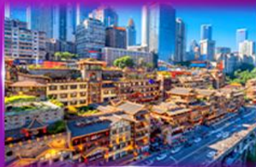
เข็ฉฉินย่านต้ง หงหยาดัง