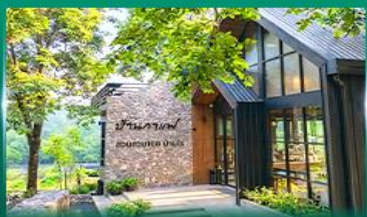
ร้านอาหาร สวนสวย 168