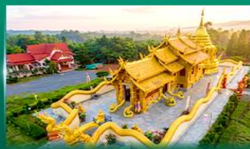
วัดเทพอินทรประดิษฐ์