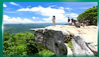
จุดชมวิวดาสุดแผ่นดิน