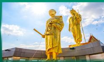
หลวงพ่อกุณ วัดบ้านไร่