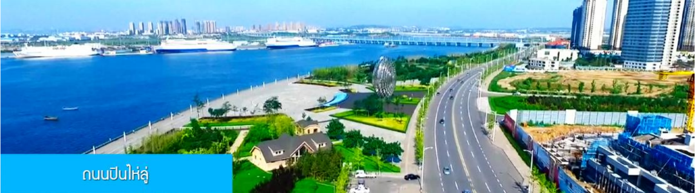
ถนนปินไห่ลู่

ล้อมด้วยตึกระฟ้าที่ทันสมัย ภายในมีบ่อน้ำพุดนตรี ลานหญ้าขนาดใหญ่ และลานกว้างสำหรับจัดกิจกรรม กลางแจ้ง อาทิ เทศกาลเบียร์นานาชาติ การแข่งขันวิ่งมาราธอน งานแฟชั่นนานาชาติเมืองต้าเหลียน ฯลฯ