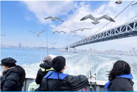
นั่งเรือใบออกทะเลลิ้นกนางนวล

ต่อด้วยนำท่านเที่ยวชมถนนรัสเซีย 俄罗斯风情街 ในอดีตที่นี่เป็นศูนย์ที่ตั้งของที่ทำการเมืองต้าเหลียน ภายหลังได้กลายเป็นชุมชนของพ่อค้าและวิศวกรทางรถไฟชาวรัสเซีย บริเวณนี้จึงเต็มไปด้วยอาคารบ้านเรือนแบบตะวันตก(รัสเซีย) มากมาย นอกจากนี้ได้เก็บภาพที่มีพื้นหลังเป็นอาคารสถาปัตยกรรมตะวันตก ที่นี้ยังมีร้านค้าที่จำหน่ายสินค้าและของที่ระลึกที่น่าเข้าจากรัสเซีย อาทิ ช็อกโกแลต เหล้าวอดก้า ตุ๊กตารัสเซีย ฯลฯ