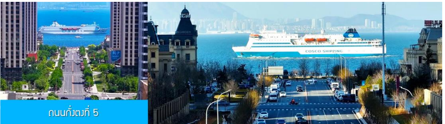
ถนนกั๋วตงที่ 5