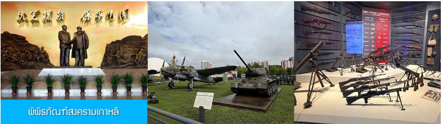
พิพิธภัณฑ์สงครามเกาหลี