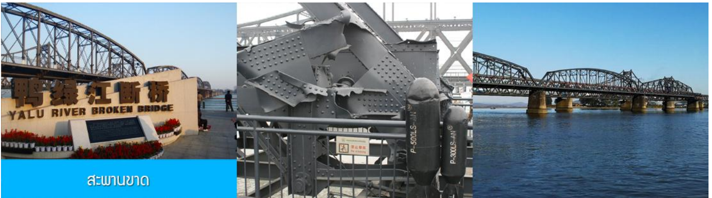
สะพานขาด