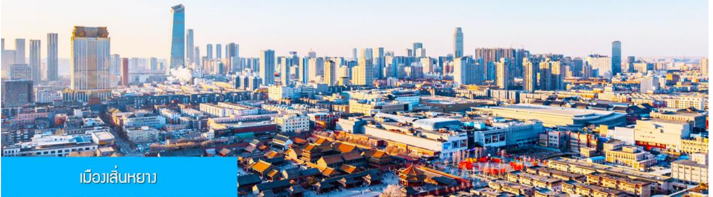
เมืองเสิ่นหยาง