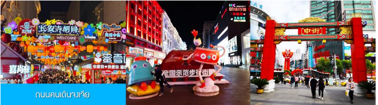
ถนนคนเดินจางเจีย