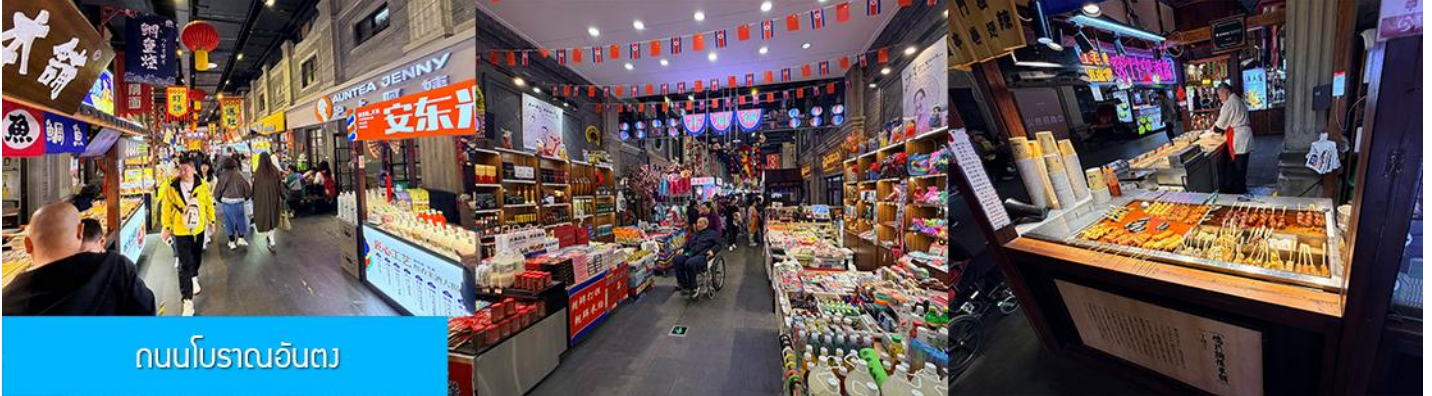
ถนนโบราณอันตง

จากนั้นนำท่านเที่ยวชม ถนนโบราณอันตง 安东老街 ถนนโบราณนี้เริ่มมีชื่อเสียงในฐานะเป็นย่านการค้าที่คึกคักที่สุดในใจกลางเมืองอันตง (ภายหลังได้เปลี่ยนชื่อเป็นต้นตง) ในปีค.ศ. 1876 ในสมัยราชวงศ์ชิง ปัจจุบันถนนสายนี้ยังคงไว้ซึ่งอาคารบ้านเรือนยุคเก่า(ราชวงศ์ชิง) และอบอวลด้วยวัฒนธรรมพื้นเมือง โบราณ ท่านจะได้สัมผัสการละเล่นและการแสดงพื้นเมือง ร้านค้าจำหน่ายของที่ระลึก ร้านอาหารท้องถิ่น และสตรีทฟู้ด ฯลฯ