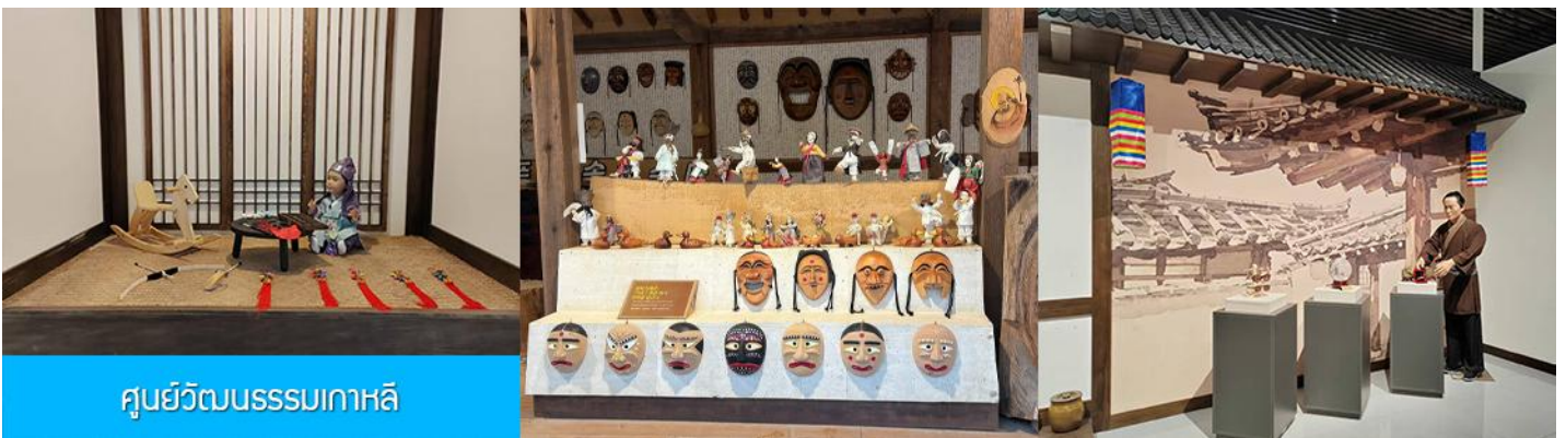
ศูนย์วัฒนธรรมเกาหลี

เช้า รับประทานอาหารเช้า ณ ห้องอาหารของโรงแรม (9)