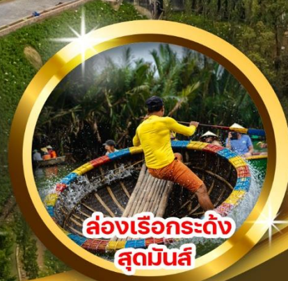
ล่องเรือกระดัง สุดมันส์