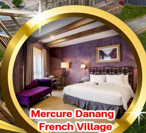
Mercure Danang French Village