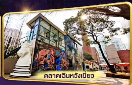
ตลาดเงินหวังเมี่ยว