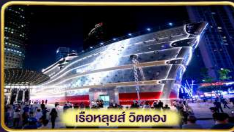
เรือหลุยส์ วัดตอง