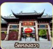
วัดหลงฮวา