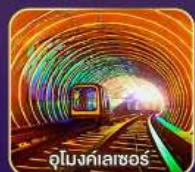
อุโมงค์ลาสซอร์