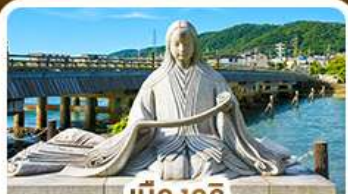
เมืองอูจิ