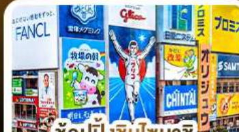
ช้อปปิ้งชินโซบาชิ และโดคังโบริ