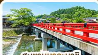
สะพานนากะบาชิ ทาดายาม่า