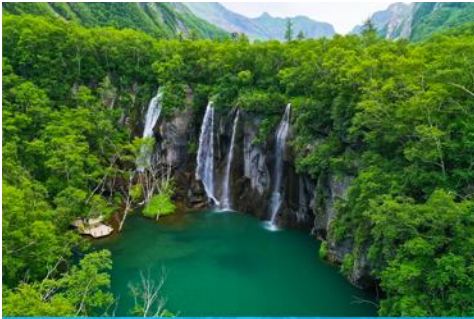
ละน้ำมรกต