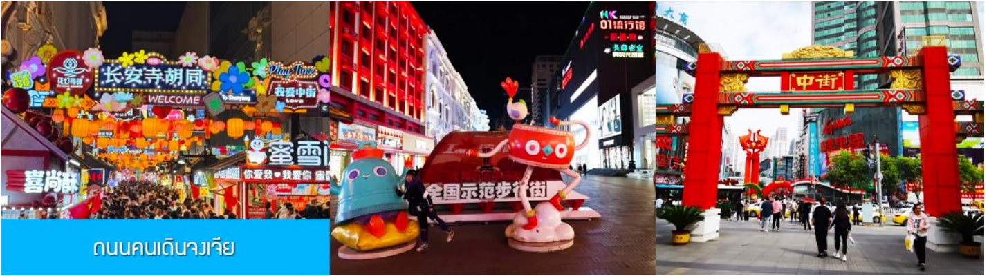
ถนนคนเดินจางเจีย