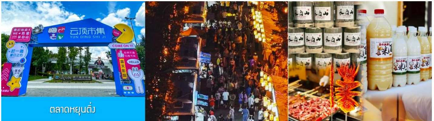
ตลาดหยุนต้ง