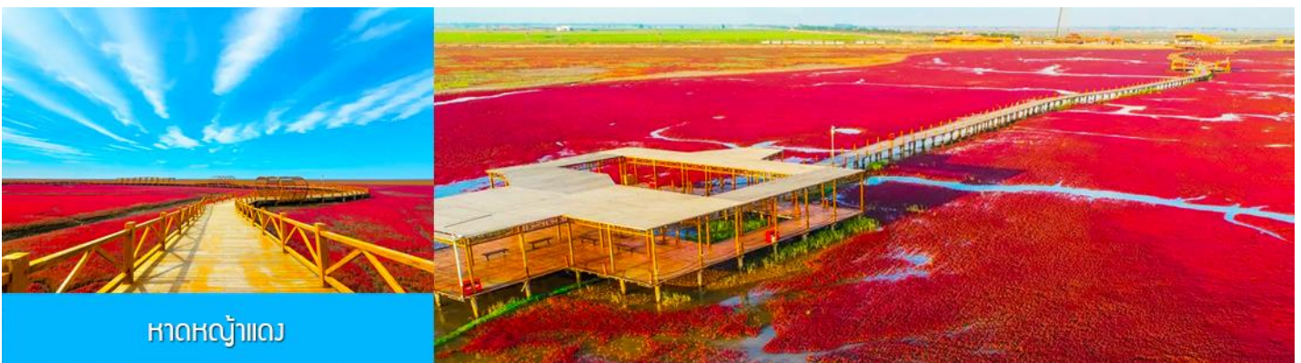
หาดหญ้าแดง

หลังอาหารเช้าเดินทางสู่ เมืองผานจิน 盘锦 (ระยะทาง 170 กม. ใช้เวลาเดินทางราว 2 ชั่วโมงเศษ)