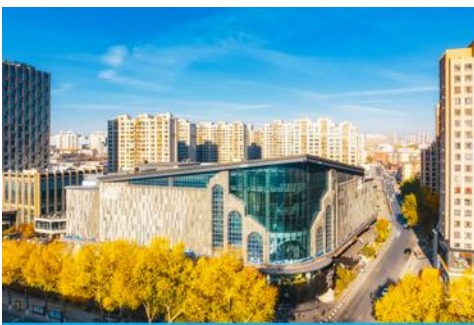
ศูนย์การค้าเจ้อโฮ่วชาน

จากนั้นนำท่านเดินทางสู่เมืองฉางชุน 长春 (ระยะทาง 300 กม. ใช้เวลาเดินทางราว 3 ชั่วโมงครึ่ง)