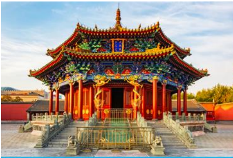
พระราชวังโบราณเสิ่นหยาง