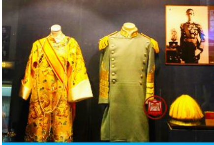
พระราชวังปู้ยี้