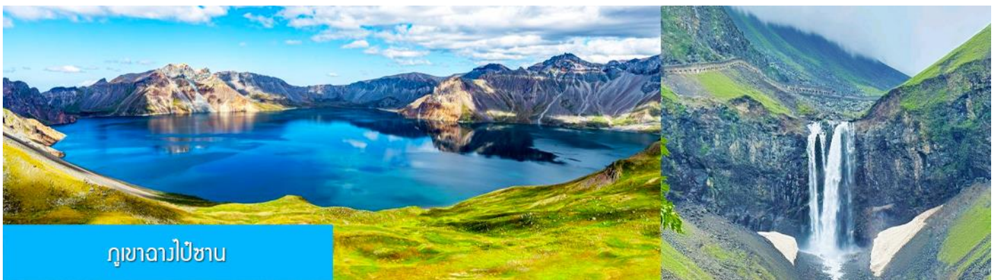
ภูเขาฉางไป๋ซาน

หลังอาหารนำท่านเที่ยวชม ยอดเขาฉางไป๋ซาน 长白山 (จีน/ลงเนินด้านทิศเหนือ) ชมความงามที่เร้นลับของ ทะเลสาบเทียนฉือ 天池 ที่เชื่อกันว่าเป็นแหล่งน้ำศักดิ์สิทธิ์ที่อยู่ใกล้สวรรค์จนเป็นที่มาของคำว่าเทียนฉือที่แปลว่าทะเลสาบบนสวรรค์ ชม น้ำตกเขาฉางไป๋ซาน 长白山瀑布 เป็นน้ำตกที่ไหลลงมาจากหน้าผาขนาดใหญ่ที่มีความสูง 68 เมตร น้ำตกแห่งนี้เป็นจุดน้ำไหลออกของทะเลสาบเทียนฉือ และเป็นต้นกำเนิดของแม่น้ำซางฮัวเจียง....ชม สระน้ำมรกต 绿渊潭 สระน้ำสีเขียวมรกตที่มีน้ำตกน้อยสองสายที่คอยเติมน้ำเข้าไปในสระ เป็น