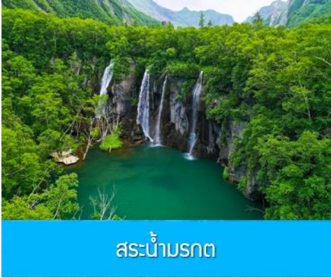
ละน้ำมรกต