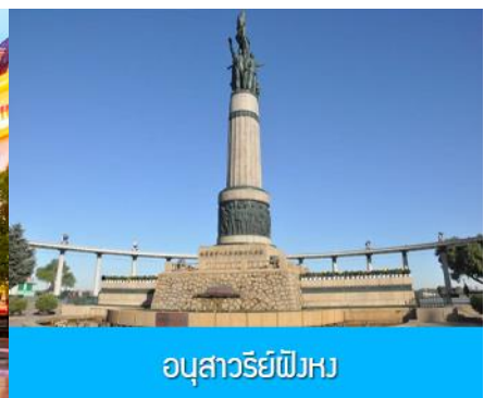
อนุสาวรีย์พิงหว