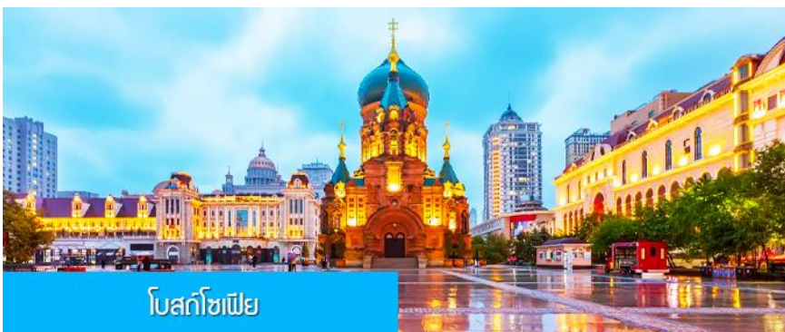
โบสถ์โซเฟีย