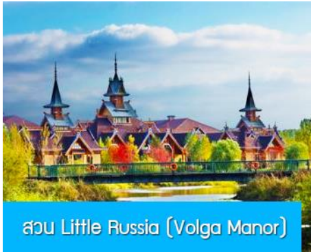
สวน Little Russia (Volga Manor)