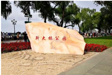
สวนสตาลิน