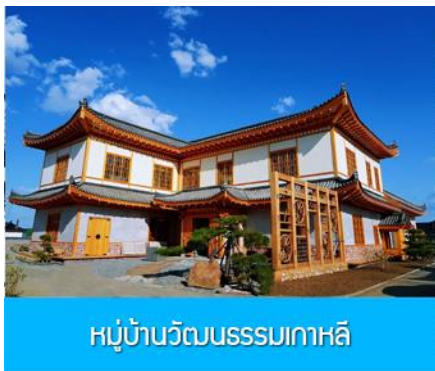
หมู่บ้านวัฒนธรรมเกาหลี

จากนั้นนำท่านเดินทางสู่เมืองตุนฮว่า 敦化 (ระยะทาง 130 กม. ใช้เวลาเดินทางราว 2 ชั่วโมง)