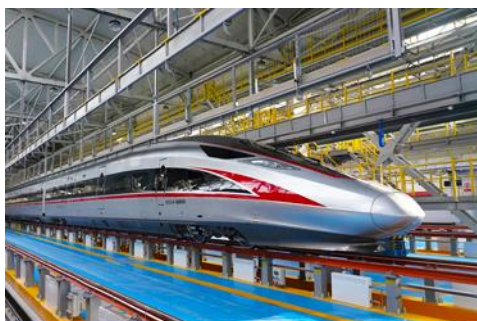
เบียร์รถไฟความเร็วสูง

หลังอาหารนำท่านเดินทางสู่สถานีรถไฟความเร็วสูงเมืองฮาร์บิ้น เตรียมขึ้นรถไฟความเร็วสูงสู่กรุงปักกิ่ง