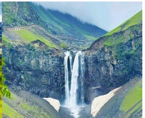
ภูเขาฉางไป่ชาน

หลังอาหารนำท่านเที่ยวชม ยอดเขาฉางไป่ชาน 长白山 (ขึ้น/ลงเนินด้านทิศเหนือ) ชมความงามที่เร้นลับของ ทะเลสาบเทียนจื่อ 天池 ที่เชื่อกันว่าเป็นแหล่งน้ำศักดิ์สิทธิ์ที่อยู่ใกล้สวรรค์จนเป็นที่มาของคำว่าเทียนจื่อที่แปลว่าทะเลสาบบนสวรรค์ ชม น้ำตกเขาฉางไป่ชาน 长白山瀑布 เป็นน้ำตกที่ไหลลงมาจากหน้าผาขนาดใหญ่ที่มีความสูง 68 เมตร น้ำตกแห่งนี้เป็นจุดน้ำไหลออกของทะเลสาบเทียนจื่อ และเป็นต้นกำเนิดของแม่น้ำซางฮัวเจียง....ชม สระน้ำมรกต 绿渊潭 สระน้ำสีเขียวมรกตที่มีน้ำตกน้อยสองสายที่คอยเติมน้ำเข้าไปในสระ เป็น