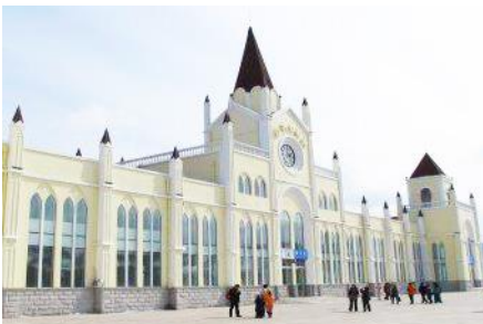
สถานีรถไฟยาบูลี

หมายเหตุ เพื่อความสะดวกในการเข้าพักใน HOME STAY ภายในหมู่บ้านหิมะ ทางทัวร์แนะนำให้ท่านจัดเตรียมเสื้อผ้าและเครื่องใช้เท่าที่จำเป็น 1 ชุดใส่กระเป๋าใบเล็กหรือเป้แบบสะพายได้ เพื่อสะดวกในการนำติดตัวไปใช้สำหรับคืนที่นอนในหมู่บ้านหิมะ หากนำกระเป๋าเดินทางใบใหญ่เข้าสู่ที่พักในหมู่บ้านอาจสร้างความไม่สะดวกแก่ท่าน จึงไม่แนะนำ