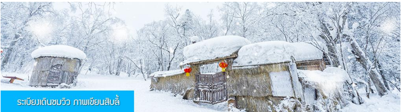
ระเบียงเดินชมวิว ภาพเขียนสิบลี้