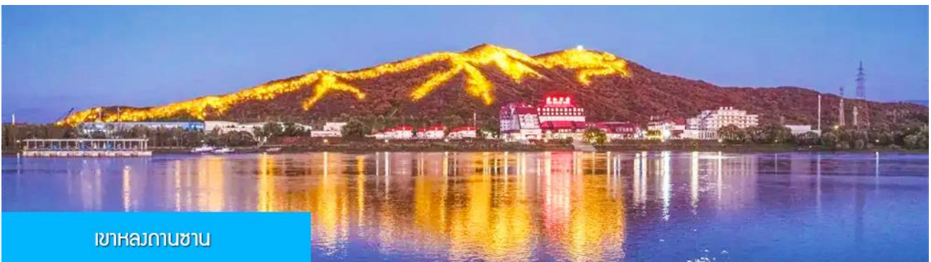
เขาสวยงาม

หลังอาหารนำท่านผ่านชม วิวยามค่ำของเขา หลงถานซาน 龙潭山夜景 (ผ่านชมระยะไกล) ภูเขารูปทรงคล้ายมังกรในช่วงกลางคืนภูเขาถูกประดับด้วยแสงไฟที่สามารถมองเห็นแต่ไกล คล้ายรูปมังกร (บางคนมองว่าคล้ายรูปไดโนเสาร์) จากนั้นนำท่านเดินทางเข้าที่พัก