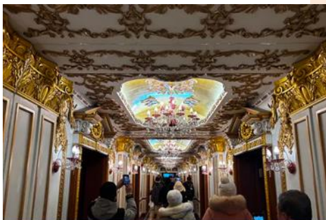
ตึกเภสัชกรรมฮาร์บิน

จากนั้นนำท่านเที่ยวชม ถนนมายังฤดู 中央大街 ถนนสายหลักของเมืองฮาร์บิน ถนนที่เต็มไปด้วยอาคารบ้านเรือนที่เป็นสถาปัตยกรรมตะวันตกที่สร้างในช่วงคริสต์ศตวรรษที่ 18 – 19 ที่เมืองนี้ถูกปกครองโดยรัสเซีย อีกทั้งเป็นถนนคนเดินที่เป็นแหล่งรวมร้านค้าสินค้าแบรนด์เนมทั้งในและต่างประเทศ ร้านจำหน่ายของที่ระลึกและสินค้าพื้นเมือง ร้านอาหารพื้นเมืองต่าง ๆ มากมาย ให้ท่านมีเวลาอิสระเดินเที่ยวและช้อปปิ้ง หรือลิ้มรสอาหารพื้นเมืองตามอัธยาศัย.. **ให้ท่านลิ้มรสไอศกรีมชื่อดังเก่าแก่ของเมืองฮาร์บินท่านละ 1 ท่านฟรี