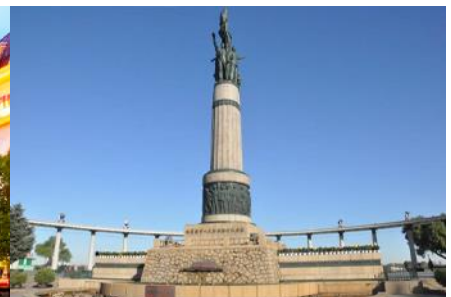
อนุสาวรีย์พิงหง