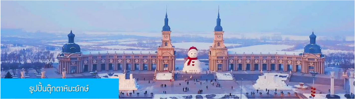
รูปปั้นตุ๊กตาคิมะฮิมะ

ความสูง 18 เมตร ที่ทางเทศบาลเมืองฮาร์บินจัดทำขึ้นในช่วงฤดูหนาวของทุกปี เช่นเดียวกับการประดับต้นคริสต์มาสในช่วงเทศกาลของชาวตะวันตก จนกลายเป็นสัญลักษณ์แห่งฤดูหนาวของเมืองฮาร์บิน