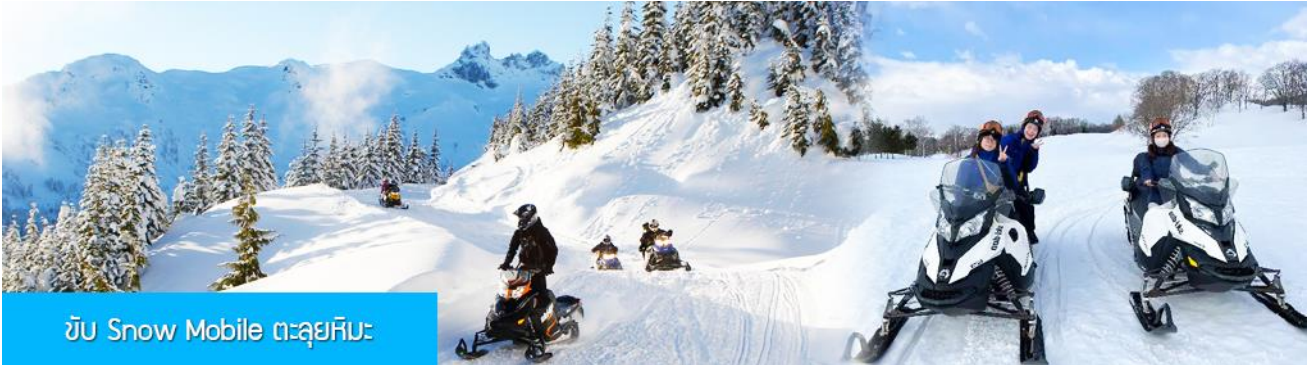
ขับ Snow Mobile ตะลุยหิมะ

ไกด์ท้องถิ่นนำเสนอโปรแกรมเสริม หรือ OPTIONAL TOUR ให้ท่านเลือกตามความสมัครใจ