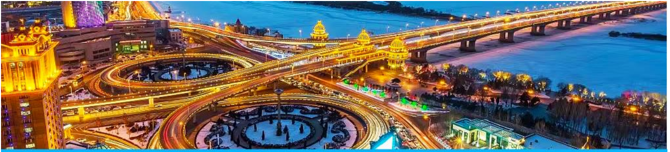
นครฮาร์บิน