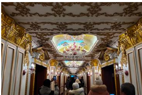
ตึกเภสัชกรรมฮาร์บิน

จากนั้นนำท่านเที่ยวชม ถนนจงย้ง 中央大街 ถนนสายหลักของเมืองฮาร์บิน ถนนที่เต็มไปด้วยอาคารบ้านเรือนที่เป็นสถาปัตยกรรมตะวันตกที่สร้างในช่วงคริสต์ศตวรรษที่ 18 – 19 ที่เมืองนี้ถูกปกครองโดยรัสเซีย อีกทั้งเป็นถนนคนเดินที่เป็นแหล่งรวมร้านค้าสินค้าแบรนด์เนมทั้งในและต่างประเทศ ร้านจำหน่ายของที่ระลึกและสินค้าพื้นเมือง ร้านอาหารพื้นเมืองต่าง ๆ มากมาย ให้ท่านมีเวลาอิสระเดินเที่ยวและช้อปปิ้ง หรือลิ้มรสอาหารพื้นเมืองตามอัธยาศัย.. **ให้ท่านลิ้มรสไอศกรีมชื่อดังเก่าแก่ของเมืองฮาร์บินท่านละ 1 ท่านฟรี