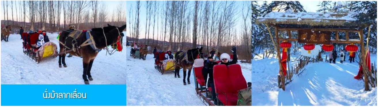
นั่งม้าลากเลื่อน