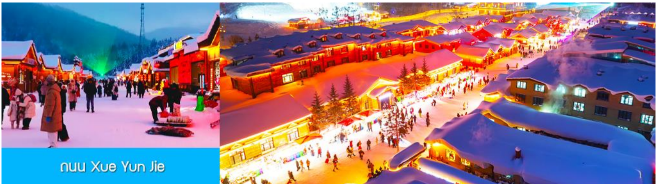
ถนน Xue Yun Jie

นำท่านสู่ระเบียงชมวิวยิวชาน 棒槌山观光栈道 เป็นระเบียงทางเดินชมวิวยิวชานบนเนินที่ทำด้วยไม้ มีความยาว 3,200 เมตร ระเบียงทางเดินชมวิวนี้นี้ได้พาดผ่านจุดชมวิวยิวชานต่าง ๆ ที่สามารถมองเห็นทัศนียภาพที่สวยงามของเมืองในเทพนิยายในมิติและมุมมองที่หลากหลาย เป็นที่นิยมของนักท่องเที่ยวที่ชื่นชอบการถ่ายภาพเป็นอย่างยิ่ง เพราะระเบียงทางเดินชมวิวยิวชานมีมุมสวย ๆ ให้ถ่ายรูปตลอดเส้นทาง, เดินบนระเบียงไม่มีค่าใช้จ่ายใด ๆ ท่านสามารถเดินชมวิวยิวชานได้ตามอัธยาศัย จนอิ่มใจ