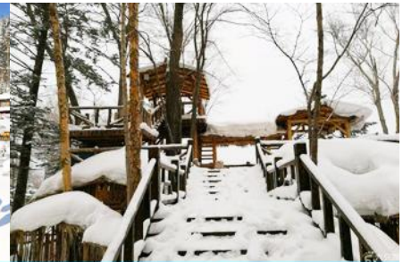
ระเบียบขมวิวเปิงจฺยฺชาน

วันที่สาม เมืองฮาร์บิน-สถานีรถไฟฮาร์บิน-รวมนั่งม้าลากเลื่อน- หมู่บ้านหิมะ Xue xiang China Snow Town - ระเบียบขมวิว เขาเปิงจฺยฺชาน- ชมแสงสียามราตรีหมู่บ้านหิมะ-ชมพลุไฟและขบวนพาเหรดระบำพื้นเมือง-นอนในหมู่บ้านหิมะ Xue xiang