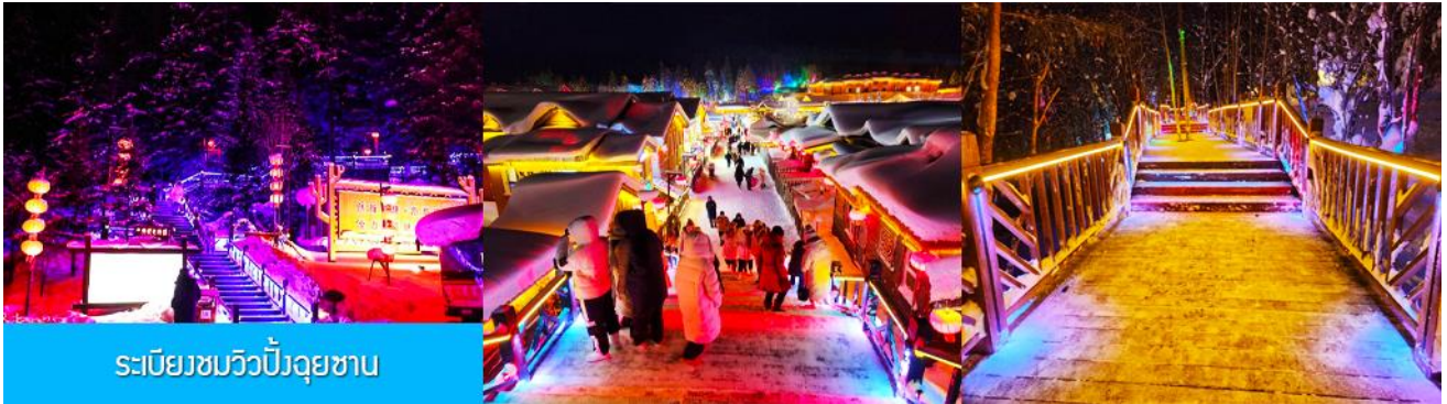
ระเบียงชมวิวยิวชาน

นำท่านสู่ระเบียงชมวิวยิวชาน 棒槌山观光栈道 เป็นระเบียงทางเดินชมวิวยิวชานบนเนินที่ทำด้วยไม้ มีความยาว 3,200 เมตร ระเบียงทางเดินชมวิวนี้นี้ได้พาดผ่านจุดชมวิวยิวชานต่าง ๆ ที่สามารถมองเห็นทัศนียภาพที่สวยงามของเมืองในเทพนิยายในมิติและมุมมองที่หลากหลาย เป็นที่นิยมของนักท่องเที่ยวที่ชื่นชอบการถ่ายภาพเป็นอย่างยิ่ง เพราะระเบียงทางเดินชมวิวยิวชานมีมุมสวย ๆ ให้ถ่ายรูปตลอดเส้นทาง, เดินบนระเบียงไม่มีค่าใช้จ่ายใด ๆ ท่านสามารถเดินชมวิวยิวชานได้ตามอัธยาศัย จนอิ่มใจ