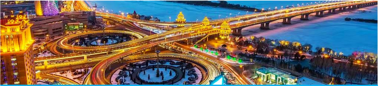
นครฮาร์บิน