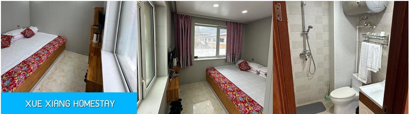
XUE XIANG HOMESTAY

ขยับแขนขาตามจังหวะดนตรี และเป็นเป็นจุดเช็คอินยอดนิยมสำหรับนักท่องเที่ยวผู้มาเยือน นอกจากนี้ที่นี่ยังมีร้านขายของที่ระลึก และร้านอาหาร แผงขายผลไม้แช่แข็ง และสินค้าพื้นเมืองต่าง ๆ มากมาย..