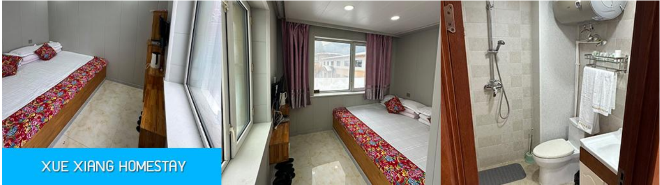
XUE XIANG HOMESTAY

ขยับแขนขาตามจังหวะดนตรี และเป็นเป็นจุดเช็คอินยอดนิยมสำหรับนักท่องเที่ยวผู้มาเยือน นอกจากนี้ที่นี่ยังมีร้านขายของที่ระลึก และร้านอาหาร แผงขายผลไม้แช่แข็ง และสินค้าพื้นเมืองต่าง ๆ มากมาย..