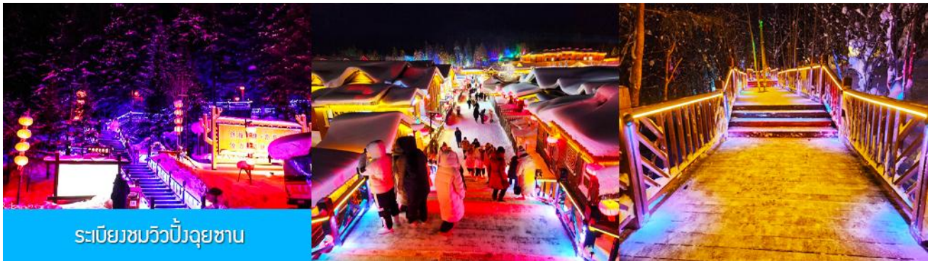
ระเบียงชมวิวยิ่งดูชวน

นำท่านสู่ระเบียงชมวิวยิ่งดูชวน 棒槌山观光栈道 เป็นระเบียงทางเดินชมวิวมุ่บ้านหิมะบนเนินที่ทำด้วยไม้ มีความยาว 3,200 เมตร ระเบียงทางเดินชมวิวนี้นี้ได้พาดผ่านจุดชมวิวยาวงาม ต่าง ๆ ที่สามารถมองเห็นทัศนียภาพที่สวยงามของเมืองในเทพนิยายในมิติและมุมมองที่หลากหลาย เป็นที่นิยมของนักท่องเที่ยวที่ชื่นชอบการถ่ายภาพเป็นอย่างยิ่ง เพราะระเบียงทางเดินชมวิวมุมสวย ๆ ให้ถ่ายรูปตลอดเส้นทาง, เดินบนระเบียงไม่มีค่าใช้จ่ายใด ๆ ท่านสามารถเดินชมวิวดำตามอัธยาศัย จนอิ่มใจ