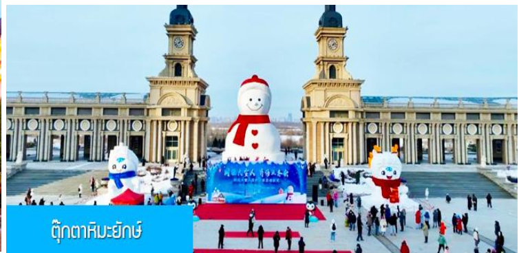
ตึกตาสหะยิกซ์