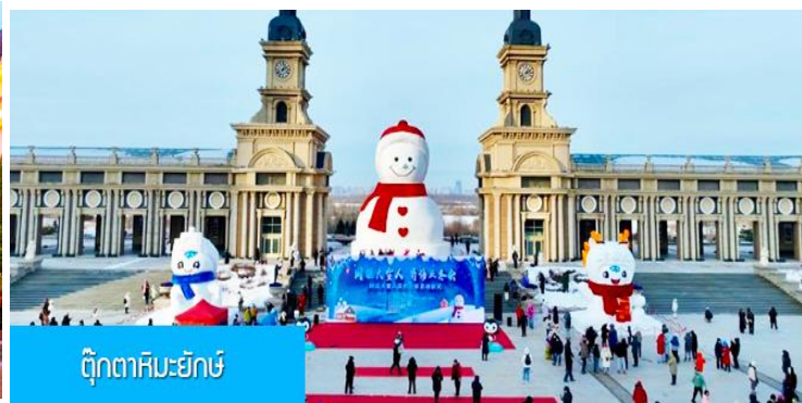
ตุ๊กตาหิมะยักษ์