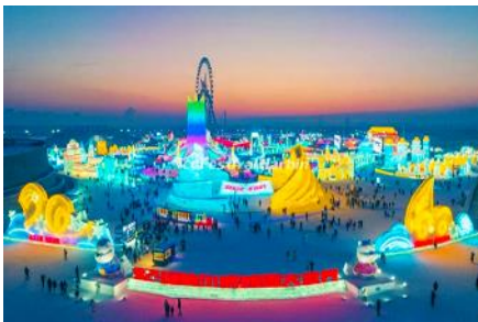
เทศกาลแกะสลักน้ำแข็งนานาชาติ

หลังอาหารนำท่านเดินทางโดยรถบัสสู่ เมืองฮาร์บิน ใช้ทางด่วนมอเตอร์เวย์กลับเข้าสู่ตัวเมืองฮาร์บิน