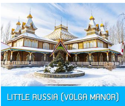
LITTLE RUSSIA (VOLGA MANOR)

เช้า รับประทานอาหารเช้า ณ ห้องอาหารของโรงแรม (11)