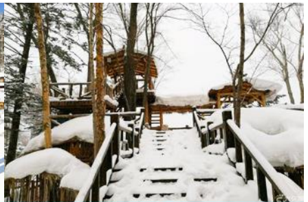
ระเบียงชมวิวปีงดูชาน

วันที่สาม เมืองฮาร์บิน-สถานีรถไฟฮาร์บิน-รวมนั่งมาลากเลื่อน- หมู่บ้านหิมะ Xue xiang China Snow Town – ระเบียงชมวิว เขาปีงดูชาน- ชมแสงสียามราตรีหมู่บ้านหิมะ-ชมพลุไฟและขบวนพาเหรดระบำพื้นเมือง-นอนในหมู่บ้านหิมะ Xue xiang