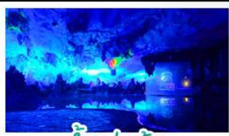
ถ้ำลู่ยอ้อ

นาหลู้อี+สะพานแดง - ล่องเรือแม่น้ำหลีเจียง นาซันบันโดสิทงอรัม - กำล้วยอ้อ - ฝางวงซ้าง เจดีย์เงินเจดีย์ทอง - รถไฟความเร็วสูง เมบูพิเศษ บูฟเฟ่ต์ย่างบาร์บีคิว ปลาอบเบียร์ เผือกคริสตัล สุกที่เค็ด