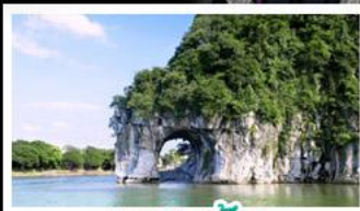
ฝางวงซ้าง