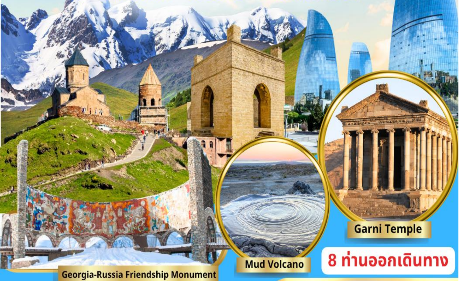
Georgia-Russia Friendship Monument