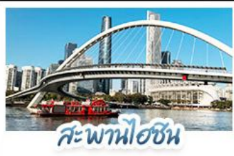
สะพานไอซิน

บินตรงทวงโจว • จัดเต็มเที่ยวสวนสนุกกลางแหล่งเต็มวัน เที่ยวจีนฟิลยุโรป ชมสถาปัตยกรรม ณ เกาะเซียมิน สักการะวัดพระใหญ่ พุทธรูปเก่าแก่กว่า 1,000 ปี ใจกลางเมืองทวงโจว เช็คอินกับแลนด์มาร์กสุดฮิตจตุรัสฮวาเจ็พถ่ายรูปกับหอทีวี ช้อปปิ้งเพลิน ถนนคนเดินอิ้อและถนนคนเดินบิกกิ่ง