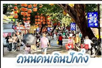
ถนนคนเดินบักกิ่ง