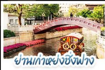
ย่านเก่าเซี่ยงชังฟาง