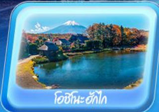
โอะชิโนะะก๊วก