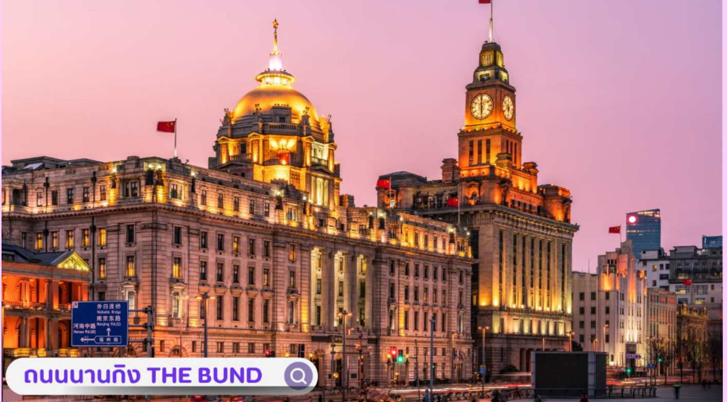
ถนนนานกิง THE BUND

**อิสระอาหารค่ำเพื่อความสะดวกในการท่องเที่ยว**