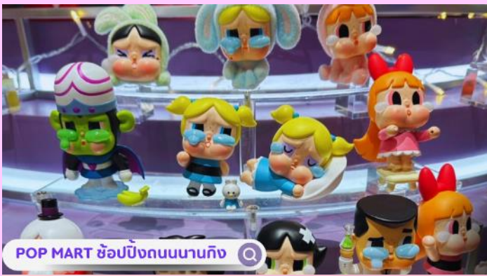
POP MART ซุปป์ิงถนนนานกิง