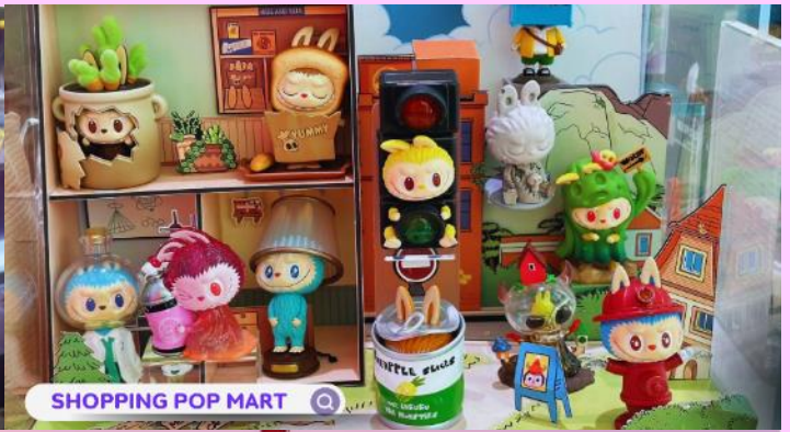
SHOPPING POP MART