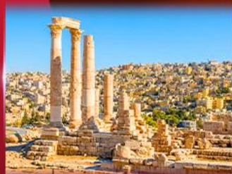
ป้อมปราการอันมาน