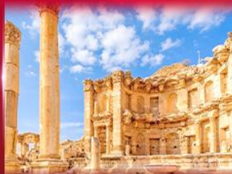
เมืองโบราณเพตรา