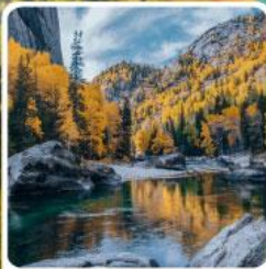
เคอเคอทัวไห่