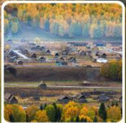
หมู่บ้านเหม่มู

สวรรค์ใบไม้เปลี่ยนสี เยือนคานาสีอแดนฝัน มหัศจรรย์หมู่บ้านเหม่มู เคอเคอทัวไห่อัศจรรย์ภูผาหิน