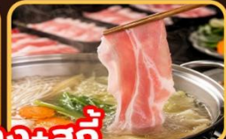
เปิดอย่าง+สุกั้