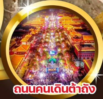
ถนนคนเดินต้าถิง