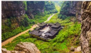
อุทยานหลุมฟ้าสะพานสวรรค์