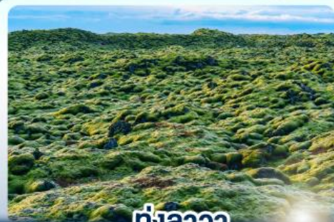
ทุ่งลาวา