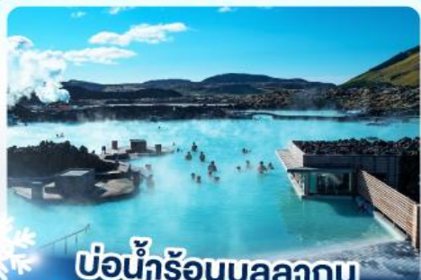
แช่น้ำร้อนบลูลาగుน

เก็บไอซ์แลนด์ แคนกูเวาไฟเคิร์กจูเฟล และ แช่น้ำร้อนบลูลาగుน