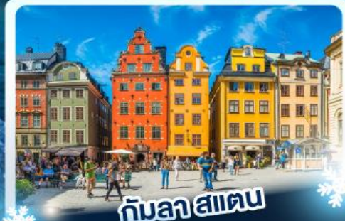
กินลาส์เตน