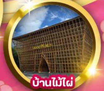
บ้านไม้ไฟ