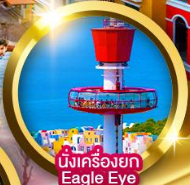
นั่งเครื่องยก Eagle Eye