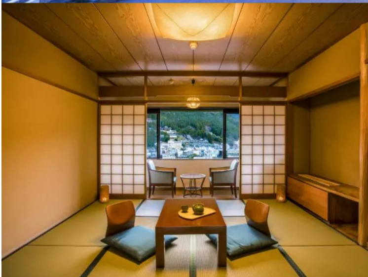
Standard Japanese-style Room 49.5m