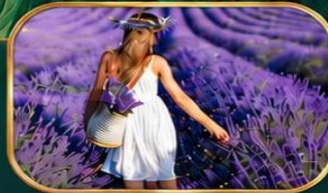
ทุ่งดอกลาเวนเดอร์ (เฉพาะช่วงเดือนกรกฎาคม - สิงหาคม)