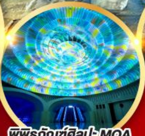
พิพิธภัณฑ์ศิลปะ MOA