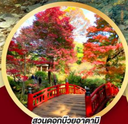
สวนคอกบึงยาคามิ