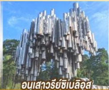
อนุสาวรีย์ซีเบลิอุส