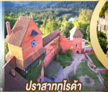
ปราสาทกูโรด้า