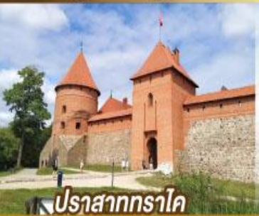
ปราสาททราไค