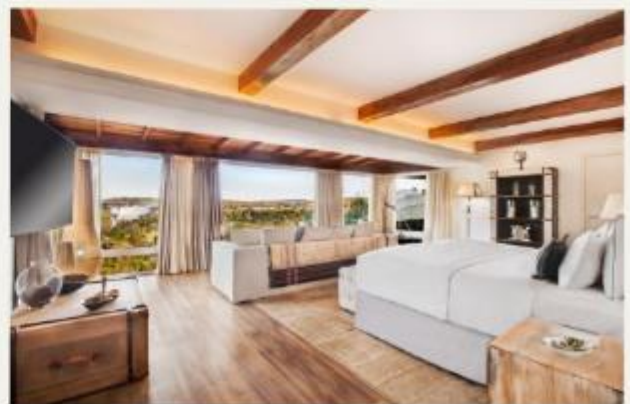
Hotel das Cataratas, A Belmond Hotel