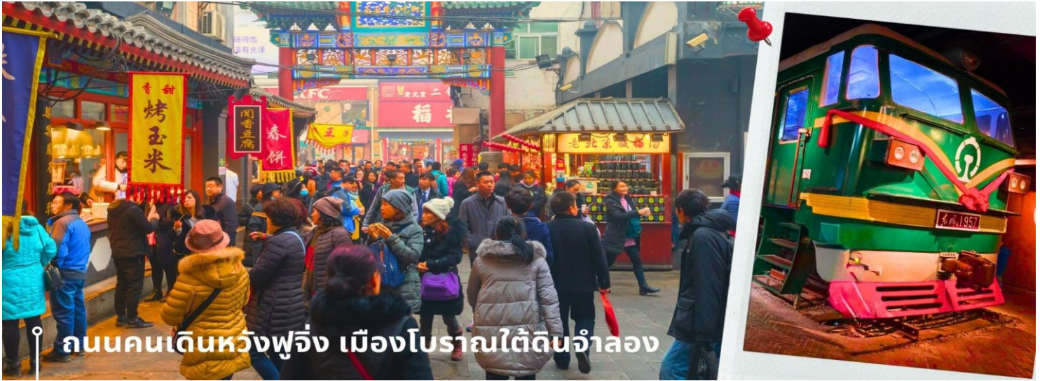
ถนนคนเดินหวังฟูจิ่ง เมืองโบราณใต้ดินจำลอง

นำท่านเดินทางไปยัง ถนนคนเดินหวังฟูจิ่ง เป็นสถานที่จัดกิจกรรมเชิงพาณิชย์ในกรุงปักกิ่งมานานหลายศตวรรษ ปัจจุบันเป็นที่นิยมอย่างมากในหมู่นักช้อปปิ้งและนักท่องเที่ยวที่แห่กันมาที่นี่เพื่อค้นหาสินค้าราคาถูกและเสื้อผ้าที่มีเอกลักษณ์เฉพาะตัว ถนนสายหลักเชิงพาณิชย์อันพลุกพล่านแห่งนี้มีร้าน บาร์ ร้านอาหาร และคาเฟ่ ซึ่งทุกแห่งมีจุดแวะพักผ่อน