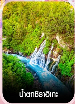
น้ำตกชิราอิเกะ