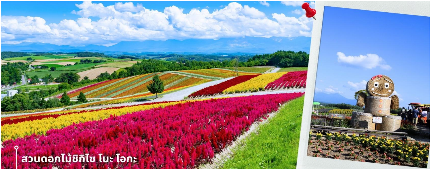
สวนดอกไม้ชิกิไซ โนะ โอะกะ

หลังรับประทานอาหารเช้า นำท่านเดินทางสู่ สวนดอกไม้ชิกิไซ โนะ โอะกะ ชื่อเต็มๆว่า Panoramic Flower Gardens Shikisai No Oka ซึ่งในช่วงซัมเมอร์จะเป็นเนินเขาสีสันสดใสกว้างสุดสายตา พื้นที่กว่า 15 เฮกตาร์ หรือประมาณ 93 ไร่ เป็นสถานที่ที่ได้ชื่อว่า มีความสวยงามทั้ง 4 ฤดู ที่สวนแห่งนี้จะมีดอกไม้หลากหลายสายพันธุ์ ทั้ง ลาเวนเดอร์ ทิวลิป โคลเคีย ทานตะวัน และอื่นๆ มากกว่า 30 ชนิดที่สลับกันไปตามฤดูกาล อย่างในช่วงซัมเมอร์ คือ