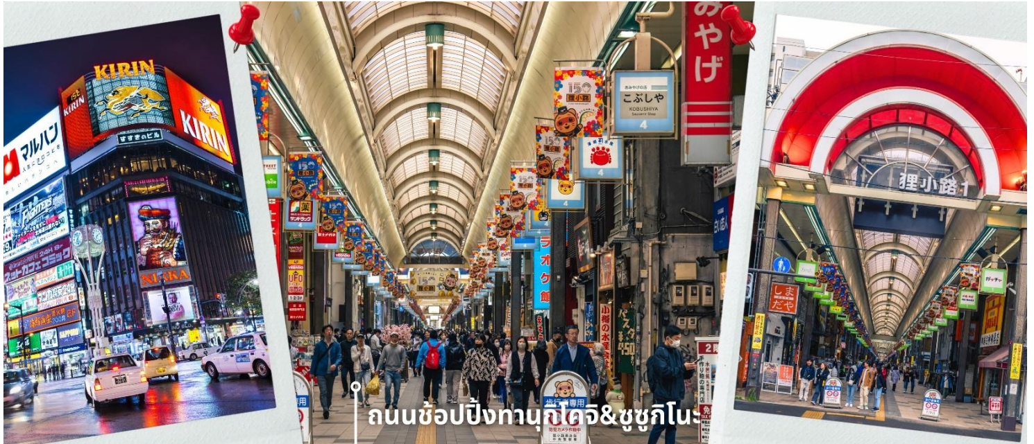
ถนนช้อปปิ้งทานุกิโคจิ & ชูชุกิโนะ

หลังรับประทานอาหารเช้า นำท่านเดินทางสู่ DUTY FREE ให้ท่านได้ช้อปปิ้งสินค้าปลอดภาษี เครื่องสำอาง ของใช้ ก่อนจะพาท่านเดินทาง ถนนช้อปปิ้งทานุกิโคจิ เป็นถนนช้อปปิ้งที่ตั้งอยู่แทบจะใจกลางเมือง Sapporo โดยมีร้านค้า ร้านอาหาร ห้างสรรพสินค้า ร้านเกม และโรงแรม รวมกันมากกว่า 200 เรียงรายยาวตั้งแต่ทิศตะวันตก ยันทิศตะวันออกยาวถึง 1 กิโลเมตร และยังมีบันไดเลื่อนลงไปทางเดินใต้ดินอีกด้วย ซึ่งทางเดินใต้ดินก็ยังมีร้านค้า ร้านอาหารอีกมากมายด้วยเช่นกัน ถนนช้อปปิ้งแห่งนี้เป็นที่ที่หลังจากแทบจะตลอดทาง ดังนั้นแล้วไม่ว่าจะฝนตก