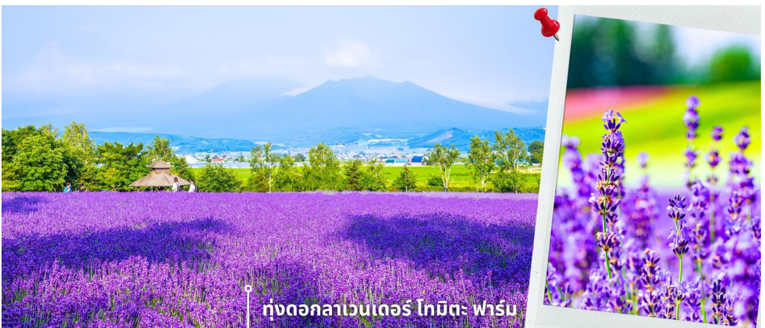
ทุ่งดอกลาเวนเดอร์ โทมิตะ ฟาร์ม

ช่วงเวลาที่ บรรดาดอกไม้และพืชพันธุ์จะบานสะพรั่งสุดสายตา พร้อมกับบรรยากาศอันสดใสรวมถึงกิจกรรมกลางแจ้งที่ทำให้ท่านเพลิดเพลิน โดยแต่ละช่วงเวลาจะมีดอกไม้ประจำฤดูกาลต้อนรับในบรรยากาศสดชื่น และยัง มีทิวเขาที่งดงามเป็นเหมือนฉากหลัง ให้ท่านได้อิสระเดินชมความสวยงามและเก็บภาพความประทับใจ จากนั้นนำท่านเดินทางสู่ ทุ่งดอกลาเวนเดอร์ โทมิตะ ฟาร์ม ตั้งอยู่ในเมืองฟูราโนะ จังหวัดฮอกไกโด เป็นแหล่งชม ทุ่งลาเวนเดอร์ที่มีชื่อเสียงและได้รับความนิยมมากที่สุดแห่งหนึ่งของญี่ปุ่น ในช่วงฤดูร้อน ทุ่งลาเวนเดอร์จะผลิบาน เรียงรายเป็นผืนกว้าง สีม่วงสดใสตัดกับท้องฟ้าและธรรมชาติรอบด้าน สร้างทัศนียภาพที่สวยงามและเป็นเอกลักษณ์ ภายในฟาร์มมีการจัดพื้นที่อย่างเป็นระเบียบ ให้ท่านสามารถเดินชมดอกไม้ ถ่ายภาพ และเพลิดเพลินกับบรรยากาศ นอกจากนี้ยังมีร้านจำหน่ายผลิตภัณฑ์จากลาเวนเดอร์ เช่น ของที่ระลึก ขนม เครื่องดื่ม ให้ท่านได้อิสระตามอัธยาศัย