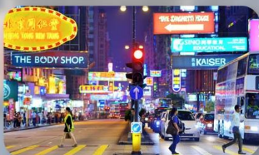
จิมซาจู้