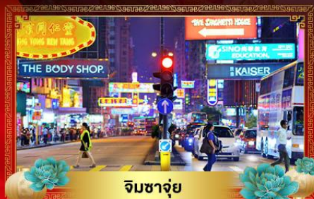
จิมซาจุ่ย