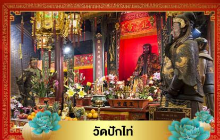
วัดปึกโท่