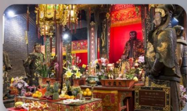
วัดปึกไต้

THE LUXE MANOR HOTEL หรือเทียบเท่า 4-5 ดาว