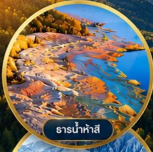
ธารน้ำห้ำสี้