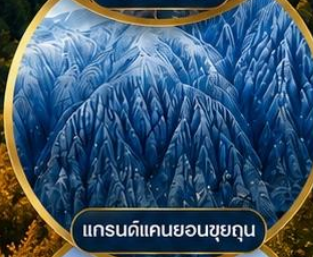
แกรนด์แคนยอนชยุทุน