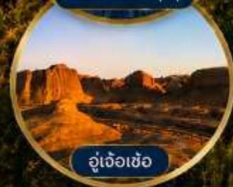
อู่เจ้อเซ่อ