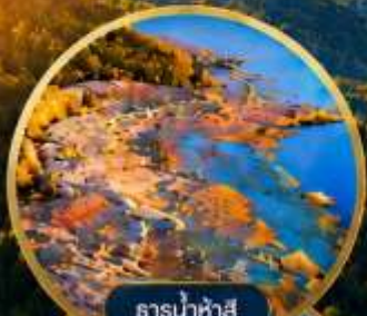
ธารน้ำห้ำสี้