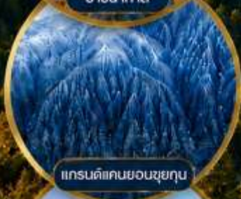
แกรนด์แคนยอนซูยกุน