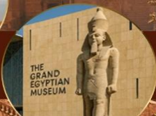
พิพิธภัณฑ์แกรนด์อียิปต์