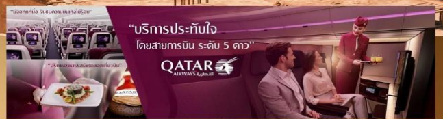
“บริการประทับใจ โดยสารการบิน ระดับ 5 ดาว” QATAR AIRWAYS