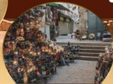
ตลาดข่านเอลคาลลี