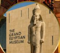
พีพีรภัณฑ์แกรนด์อียิปต์