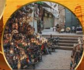
ตลาดบ้านเอลคาลิลี