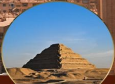
พีระมิดชั้นบันโด