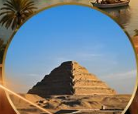
พีระมิดขั้นบันได