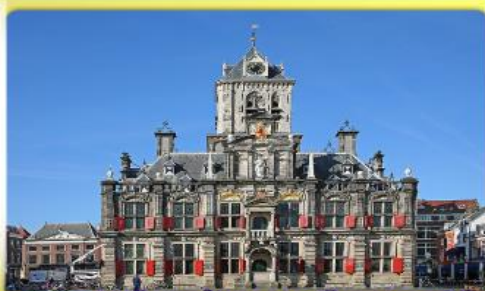
อาคารเมืองท่าคลองเมืองเคลฟท์