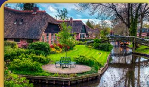
ล่องเรือหมู่บ้านไรทอนทีรูร์น