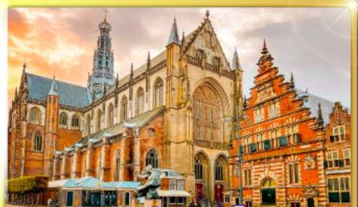
จัตุรัสเมืองฮาร์เล็ม

ชมแดนเมืองแปลกเนเธอร์แลนด์และเบลเยียม เติมน้องเคลฟท์ เมืองเครื่องปั้นดินเผาระดับโลก ฮาร์เล็มเมืองมั่งคั่งที่สุดของเนเธอร์แลนด์