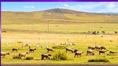
ทุ่งหญ้าซิลามูห์ริ่น