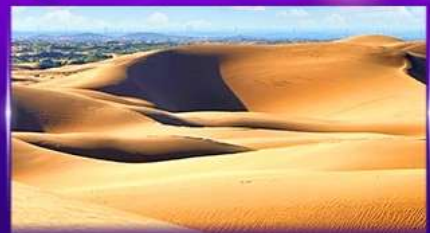
ทะเลทรายอินเคินทาลา