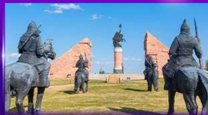
สวนสาธารณะเจงกิสข่าน