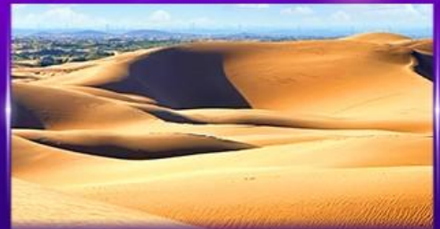
ทะเลทรายอินเคินทาลา