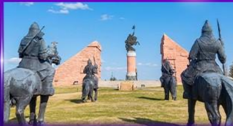
สวนสาธารณะเจงกิสข่าน