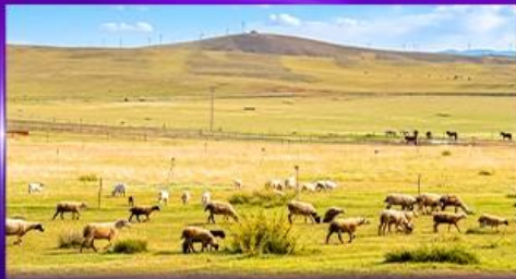
ทุ่งหญ้าชิลามูเหริน