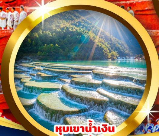
หุบเขาน้ำเงิน ทะเลสาบไป๋ส่วยเหอ