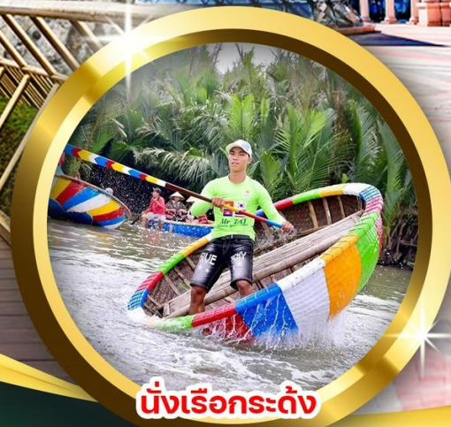
นั้งเรือกระดั่ง