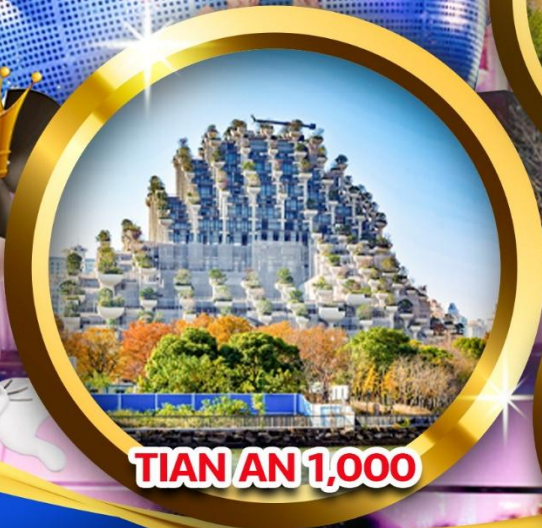
TIAN AN 1,000