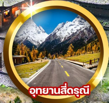
อุทยานสี่ดรุณี