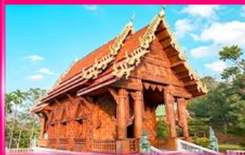
โบสถ์ไม้สักทอง