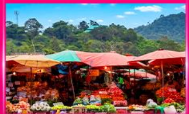
ตลาดดอยมูซอ