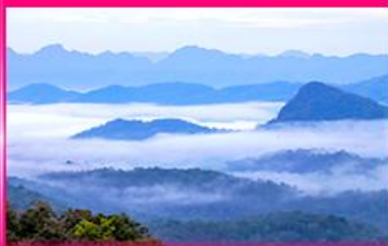
ทะเลหมอก ดอยหัวหมด