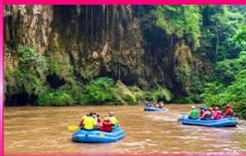
ส่องแก่ง ทิวจ๋อ - ทิวชู