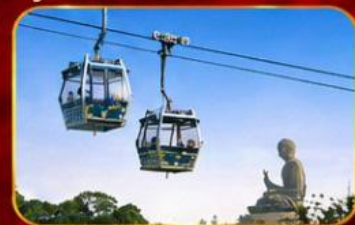
กระเชานองปิง