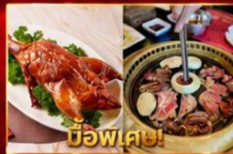
เปิดอย่างอ่องกง บุฟเฟ่ต์บึงย่างเกาหลี