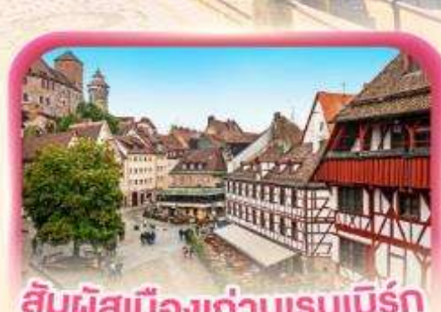
สี่มผัสเมืองเก่านูเรมเบิร์ก