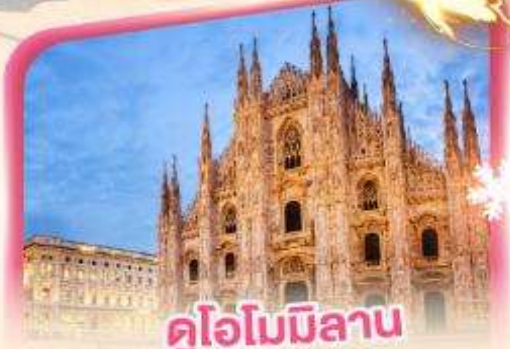
คูโอโมมิลาน