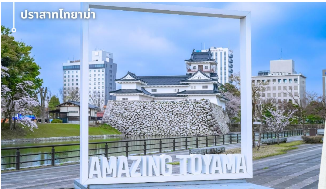
ปราสาทโทยาม่า

หลังจากรับประทานอาหารเที่ยง นำท่านเปลี่ยนบรรยากาศเข้าสู่ เมืองโทยาม่า เป็นเมืองที่มีเสน่ห์จากการผสมผสานระหว่างธรรมชาติและวัฒนธรรมได้อย่างลงตัว โดยมีฉากหลังเป็นเทือกเขาแอลป์ญี่ปุ่นอันยิ่งใหญ่ และมีชื่อเสียงด้านอาหารทะเลสดจากอ่าวโทยาม่า ซึ่งได้รับการยกย่องว่าเป็นหนึ่งในอ่าวที่อุดมสมบูรณ์ของญี่ปุ่น บรรยากาศภายในเมืองมีความสะอาด เป็นระเบียบ และเงียบสงบ สะท้อนวิถีชีวิตแบบญี่ปุ่นท้องถิ่นได้อย่างชัดเจน ภายในเมืองยังมีเส้นทางรถรางที่เป็นเอกลักษณ์ วิ่งผ่านย่านสำคัญต่าง ๆ เพิ่มเสน่ห์ให้กับทัศนียภาพของเมืองได้อย่างลงตัว นำท่านเดินทางไปที่สัมผัสความสง่างามของ ปราสาทโทยามะ Toyama Castle (ด้านนอก) แลนด์มาร์คทางประวัติศาสตร์อันเป็นสัญลักษณ์ของเมือง โดยนำท่านชมความสวยงามทางสถาปัตยกรรม ซึ่งโดดเด่นด้วยกำแพงหินสีขาวสะอาดตัดกับสีเขียวของสวนสวยรอบตัวปราสาท ท่านจะได้ชื่นชมความวิจิตรของบ่อน้ำพุร้อนที่สะท้อนเงาบนผืนน้ำในคูเมืองอย่างงดงาม พร้อมเดินเล่นถ่ายภาพปราสาทจากสวนสาธารณะที่ล้อมรอบปราสาทโทยาม่า ภายในพื้นที่มีทั้งคูน้ํา แนวต้นไม้ และพื้นที่สีเขียวที่จัดไว้อย่างเป็นระเบียบ บริเวณสวนสามารถมองเห็นตัวปราสาทสีขาวที่ตั้งโดดเด่นอยู่ท่ามกลางทัศนียภาพโดยรอบได้อย่างสวยงาม ซึ่งในแต่ละฤดูกาลจะมอบบรรยากาศที่แตกต่างกันไป มอบความรู้สึกสงบและอัมเมมไปกับเรื่องราวในอดีตที่ยังคงได้รับการรักษาไว้อย่างสมบูรณ์ท่ามกลางความทันสมัยของเมืองโทยามะ พร้อมทั้งให้ท่านได้ถ่ายรูปกับจุดไฮไลท์ภายในสวน Amazing Toyama จุดที่ท่านจะสามารถมองเห็นปราสาทโทยาม่าได้อย่างสวยงามตระการตา