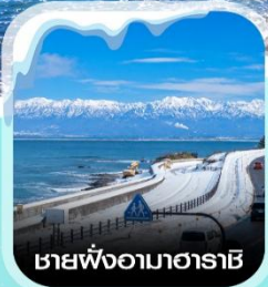
ชายฝั่งอามาฮาระชิ