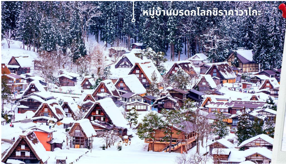
หมู่บ้านบรกดโลกชิราคาวาโกะ