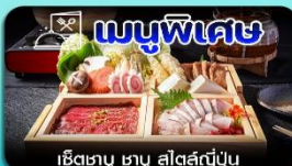
เซ็ตซาบู ซาบู สไตล์ญี่ปุ่น