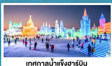
เทศกาลน้ำแข็งฮาร์บิน