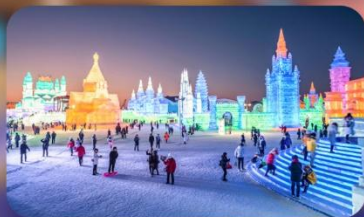
เทศกาลน้ำแข็งฮาร์บิน