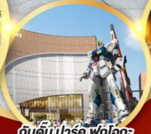
กันดั้ม ปาร์ค ฟุคุโอกะ