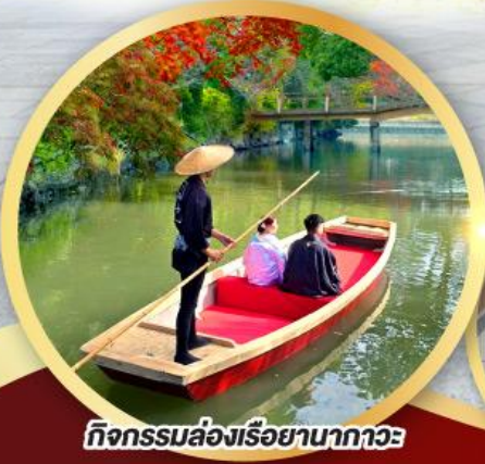
กิจกรรมล่องเรือยามากาเวะ