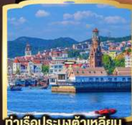
ท่าเรือประมงต้าเหลียน