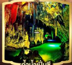
ถ้ำน้ำเป็นซี